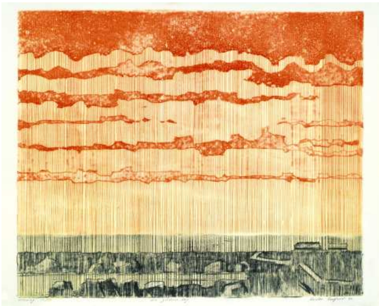
En gledens dag - Un jour joyeux - A day of joy. 1980. 49 x 59 etsning - gravure - etching