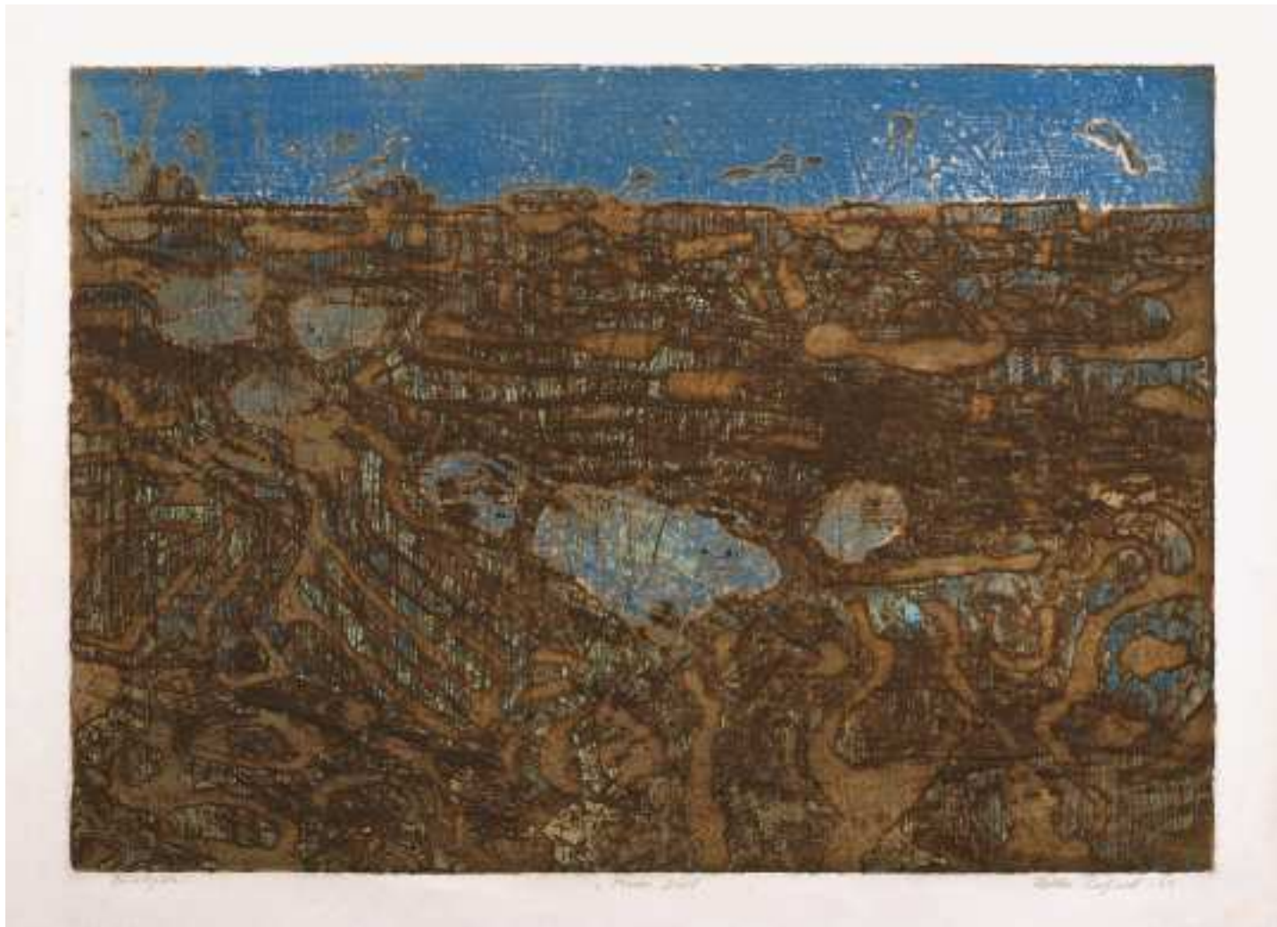
Moder jord - Terre mer - Mother earth 1965. 41 x 57 etsning - gravure - etching