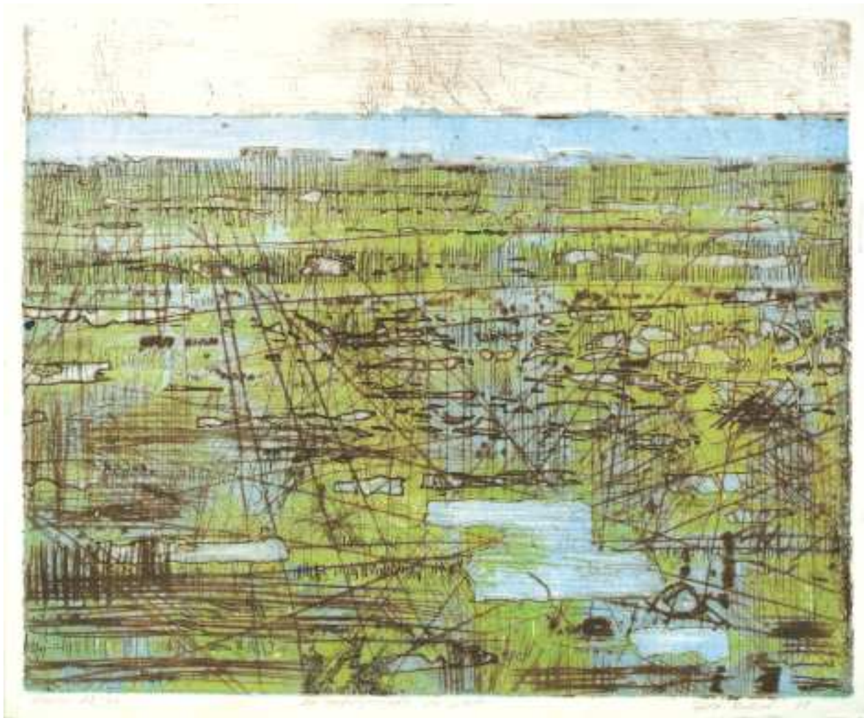
30 En landskapsstudie fra Lista - Etude paysage, Lista - Landscape study, Lista. 1975. 49 x 60 etsning - gravure - etching