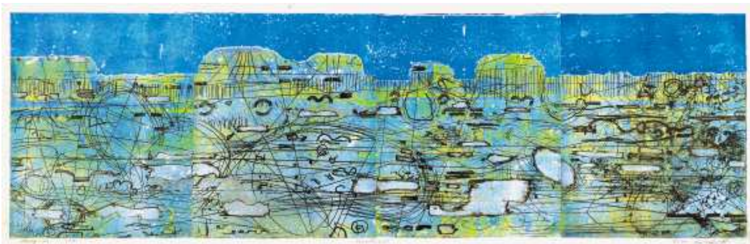
Horisont - Horizon 1975. 29 x 96 etsning - gravure - etching