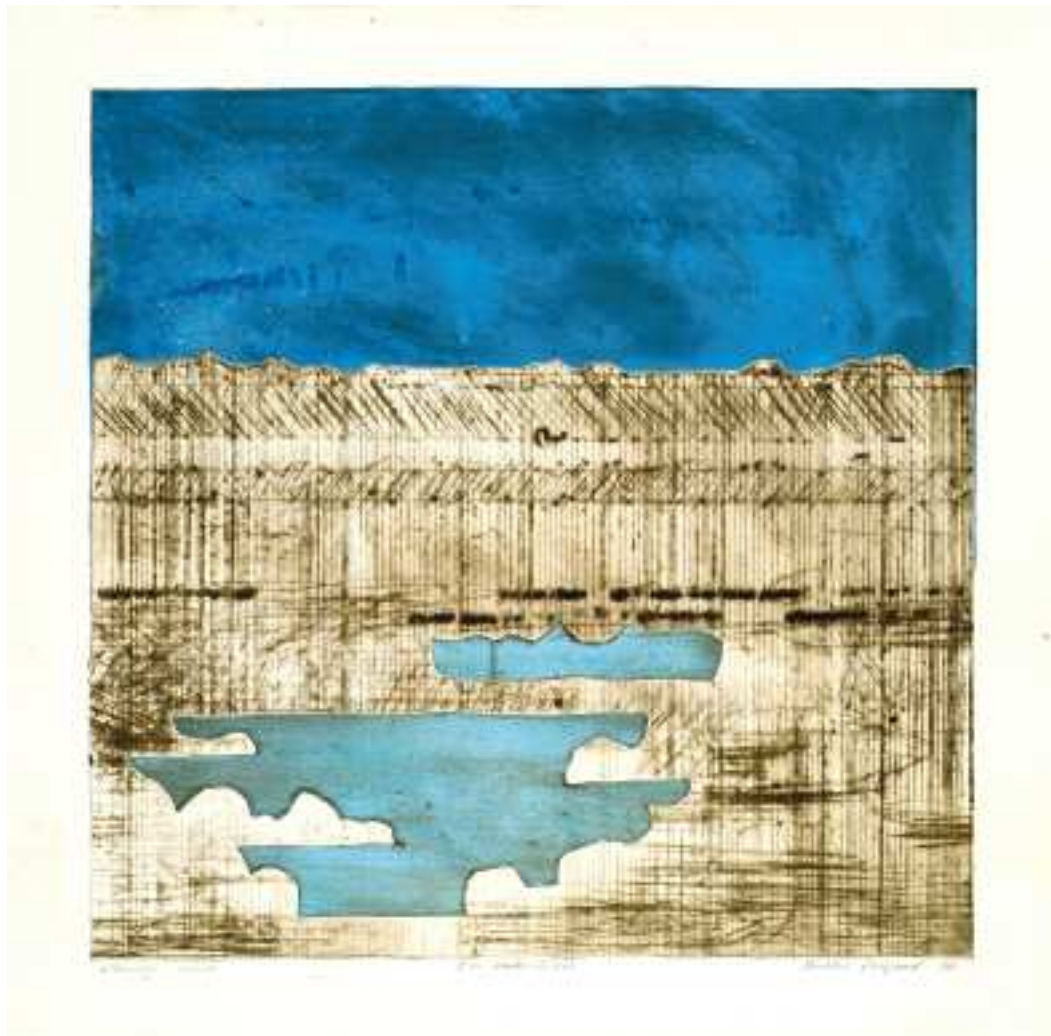
28 En raderskisse - Esquisse de gravure - Graphic Sketch. 1980. 38 x 39 etsning - gravure - etching